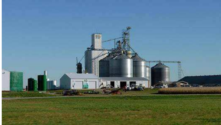
Lincolnway Energy Anlage in Iowa