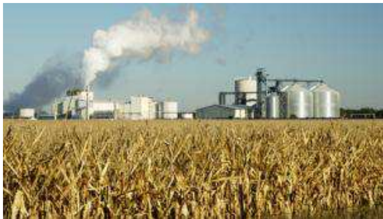
Clariant Pilotanlage in Straubing