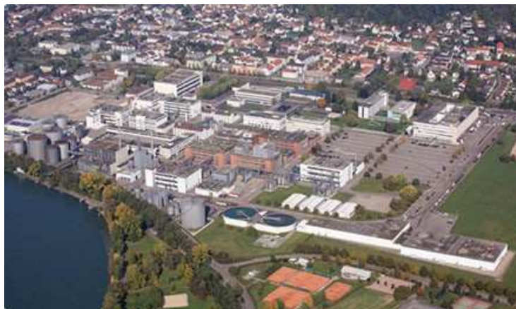
Anlagen der DSM in Grenzach